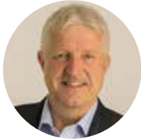
Erich Vontobel, conseiller national UDF ZH

La réforme de la LPP sur laquelle nous voterons le 22 septembre concerne la caisse de pension personnelle (CP) de tous les actifs. Cette réforme est un compromis raisonnable qui corrige considérablement les défauts existants et améliore le financement à moyen et long terme des rentes de retraite de la génération active.